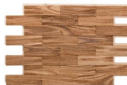
Imprægneret lys ask „Brick“: