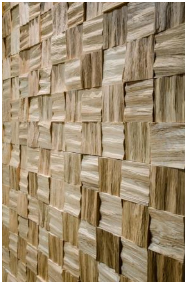
SQUARE – kvadrater (felter á 94 mm)