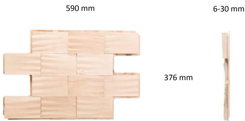
Panelet set forfra