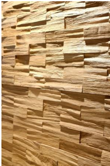
BRICK – rektangler i regelmæssigt mønster (47 x 170 mm)