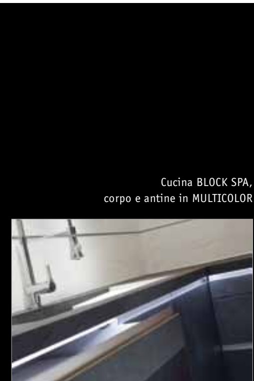
Cucina BLOCK SPA, corpo e antine in MULTICOLOR