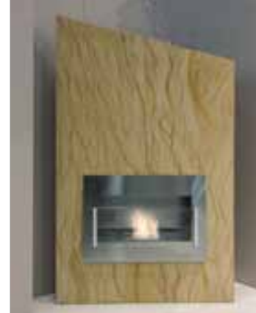
TERZOELEMENTO SRL, Verona (VR), eco-camino in SAHARA