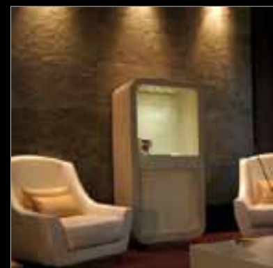
PANTHA SRL, Industria Arredo Contract, Arch. Gianni Rossi, Maserà (PD), rivestimenti murali in SILVERSHINE, senza fuga