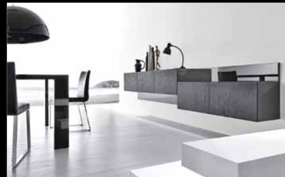
◀ PRESOTTO INDUSTRIE MOBILI SPA, Brugnera (PN), opera d'arte fin nei minimi particolari, in SILVERSHINE, Salone del Mobile 2009, Milano