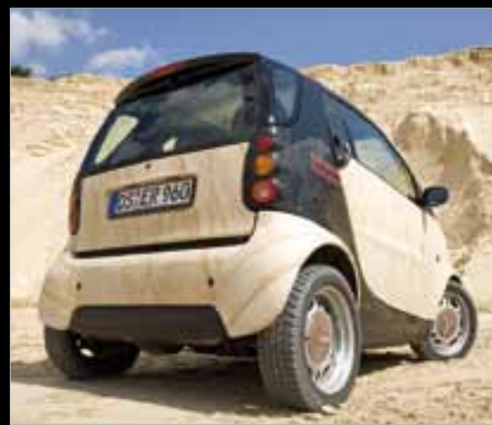
▲ Eri Design, carrozzeria di una Smart, rivestita in SAHARA ▶ Pavimentazione in SAHARA e BLACK SLATE

ITC Intercom Wolfgang Keune Via Cassina 30 / CP 130 CH 6821 Rovio / Svizzera Tel. +41 91 6494848 Fax +41 91 6494847 office@itc-intercom.ch www.itc-intercom.ch