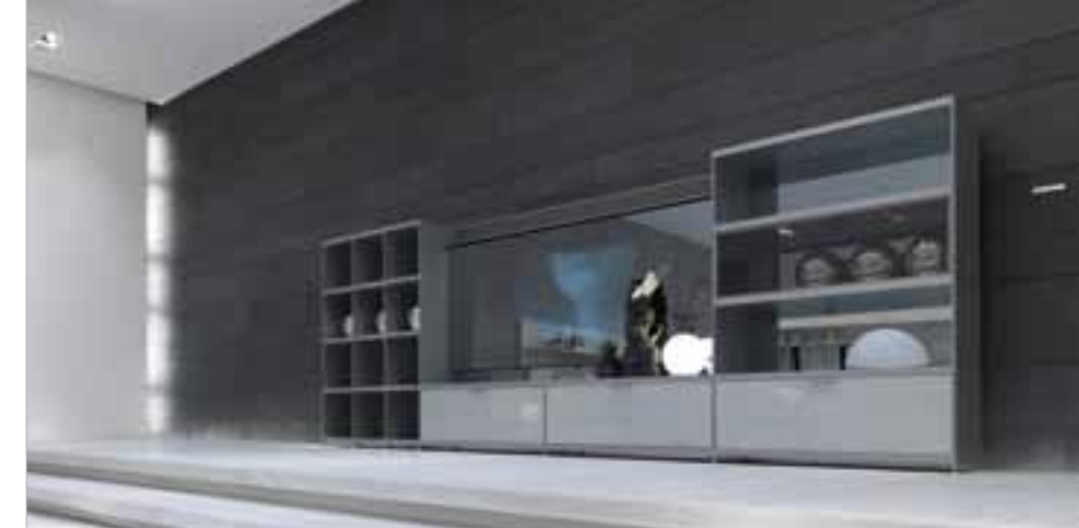
RIMADESIO SPA, Interiors & Industrial Design Arch. Guiseppe Bavuso, parete armonica ed estetica (sezione aurea), in BLACK SLATE, con fuga visibile