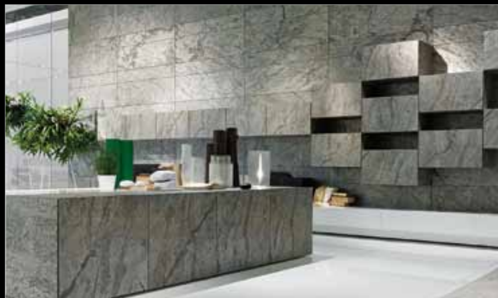
▲ UPPER SPA, Ancona (AN), pareti lavorate in MULTICOLOR Black Finish