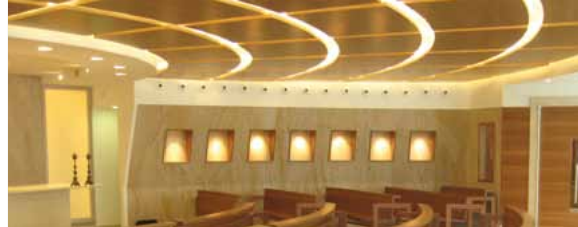
Cappella a Roma, rivestimenti murali in SAHARA