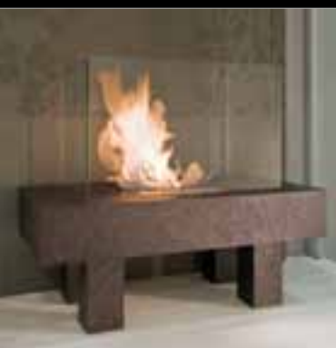
TERZOELEMENTO SRL, Verona (VR), eco-caminetto in MULTICOLOR