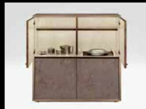
▲ ARMANI CASA, Milano, armadio AGOR in MULTICOLOR