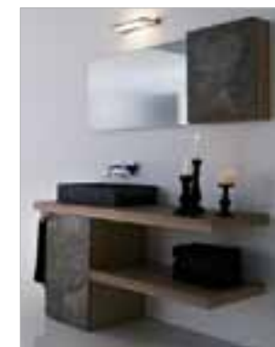
LA ROCCIA, Design Gianni Zandonà, Stevenà di Caneva (PN), mobile da bagno in JEERA GREEN